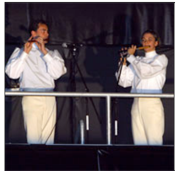
«Fife Alive»: Verwöhnen die staunenden Zuschauer mit ihrem virtuos und berauschenden Piccolospiegel.