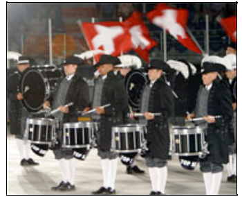
Ob in Edinburgh oder in der Eishalle zu Basel: Das «Top Secret Drum Corps» hat das Publikum dank perfektem Auftritt fest in der Hand.

Dies aber wirklich die einzige Kritik an einem fantastischen Tattoo, welches auch in der Samstag-Aufführung ein volles Haus verdient hat. Tickets kann man noch ergattern, wenn man am Nachmittag ab halb vier zwischen Bankverein und Marktplatz an der Freien Strasse steht. Die teilnehmenden